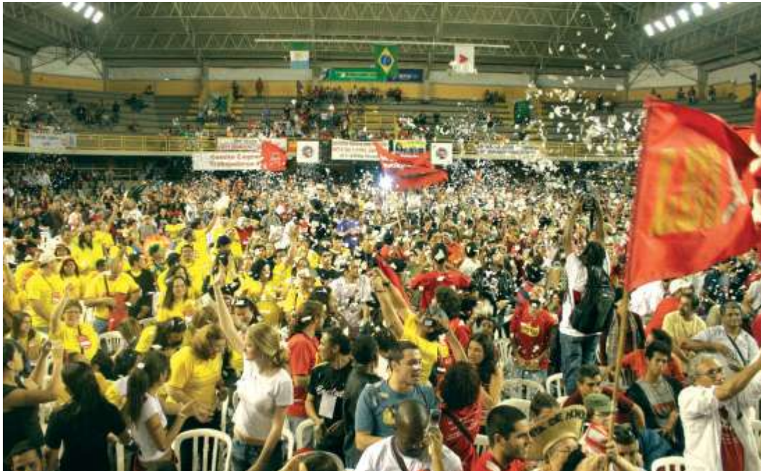
Incontro Nazionale delle Lotte promosso da Conlutas, Intersindical e Mst, nel 2007