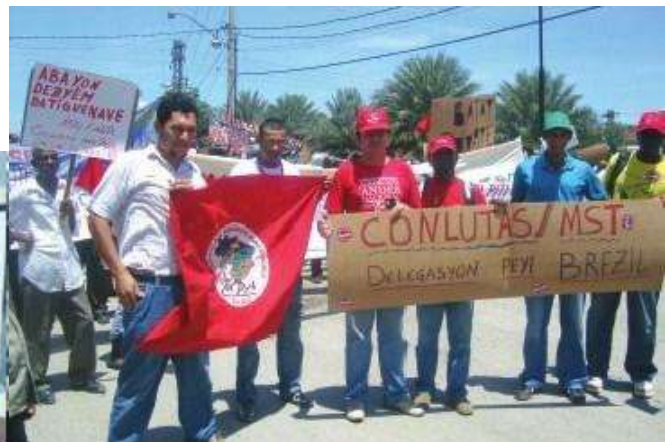
Una delegazione brasiliana trascorre il 1° Maggio 2009 a Port-au-Prince