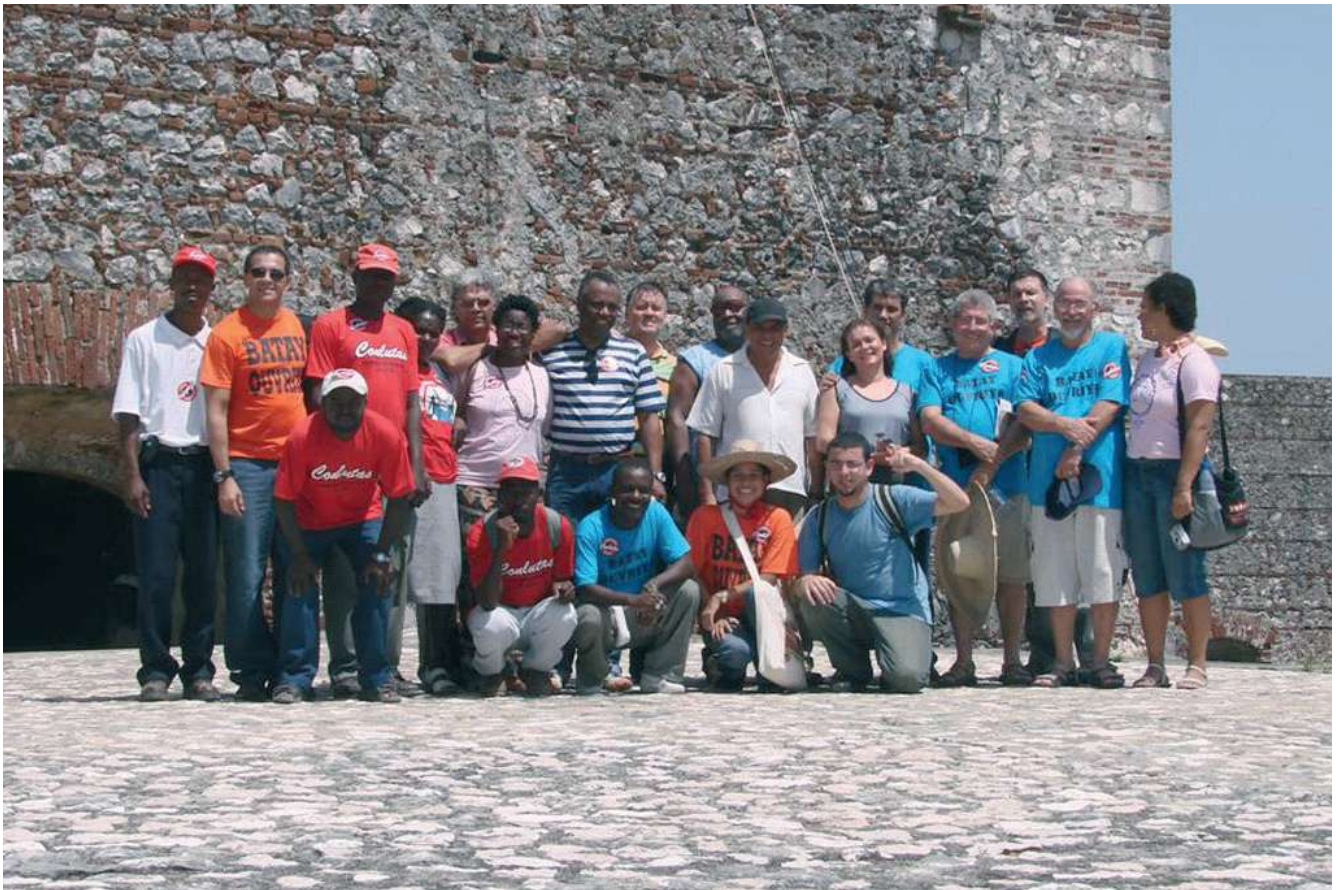
Nel 2007, rappresentanti di diverse organizzazioni vanno a conoscere la lotta del popolo haitiano