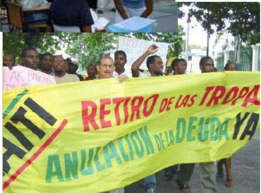
Nel 2006, una delegazione partecipa alle manifestazioni ad Haiti